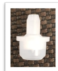
Broquet amb filtre