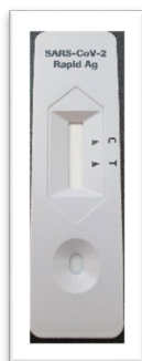
Dispositiu de la prova