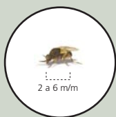
Mosca a mida real

Els simúlids o mosques negres són unes mosques autòctones, petites, d'una mida entre 2 i 6 mm, de color generalment fosc, amb el cos rabassut, les antenes i les potes curtes i les ales més grans.