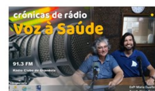
Figura 5 – Emissão de rádio com informação de saúde