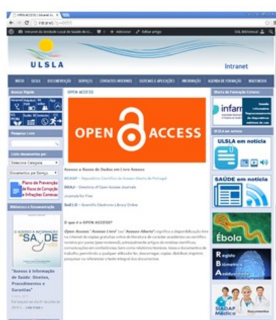
Figura 1 – Biblioteca Digital ULSLA