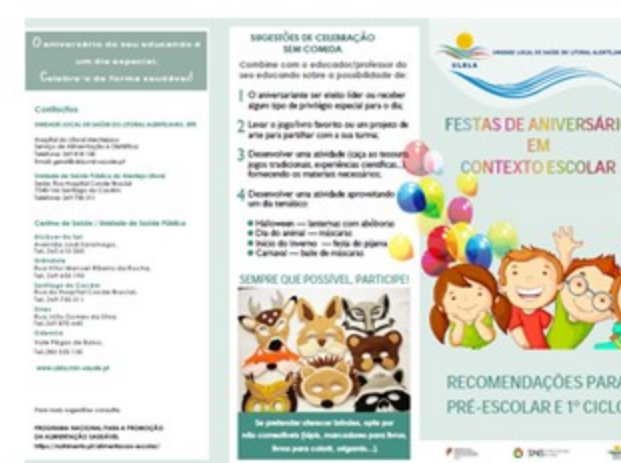
Figura 6 – Prospeto Festas de Aniversário em contexto escolar