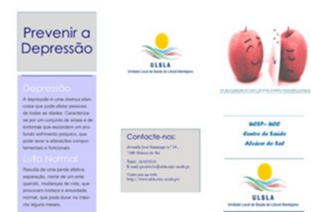
Figura 7 – Prospeto Prevenir a Depressão