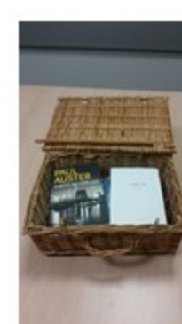
Figura 4 – Empréstimo ao Doente Internado