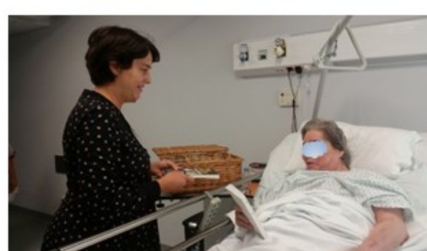
Figura 3 – Empréstimo ao Doente Internado