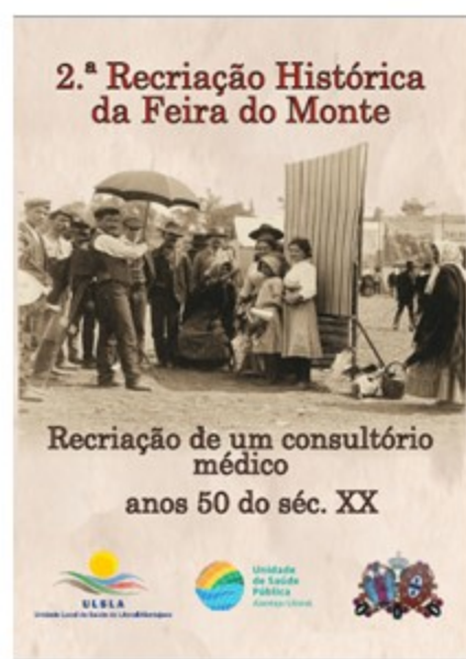
Figura 8 – Catálogo Recriação Histórica Feira do Monte 2019