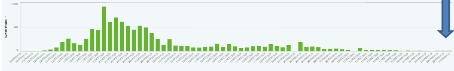
Distribution of number of confirmed cases/deaths Republic of Korea, by selected territory(ies) and period (**)