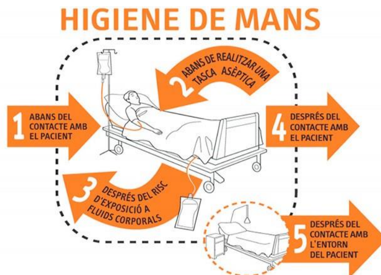
Figura 1. Els vostres 5 moments per a la higiene de mans.

En el gràfic següent es mostren els 5 moments per a la higiene de les mans en l'atenció a pacients hospitalitzats, d'acord a les recomanacions de l'OMS: