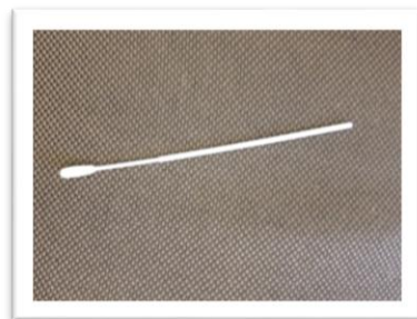
Escovilló de frotis nasal PCR