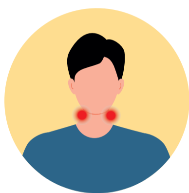
Inflamació dels ganglis limfàtics