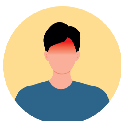
Mal de cap