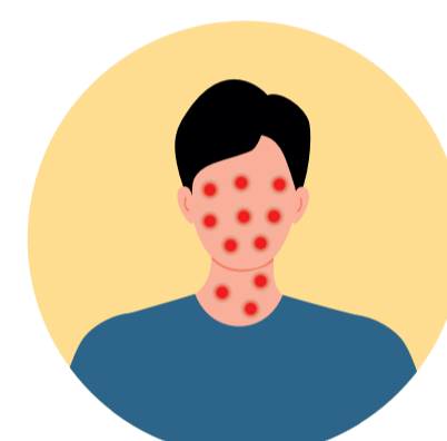
Erupcions a la cara