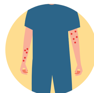
Erupcions a la resta del cos

Les erupcions són planes o lleugerament aixecades, plenes de líquid clar o groguenc que es transformen en crostes i cauen.