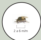
Mosca a mida real

Els simúlids o mosques negres són unes mosques autòctones, petites, d'una mida entre 2 i 6 mm, de color generalment fosc, amb el cos rabassut, les antenes i les potes curtes i les ales més grans.