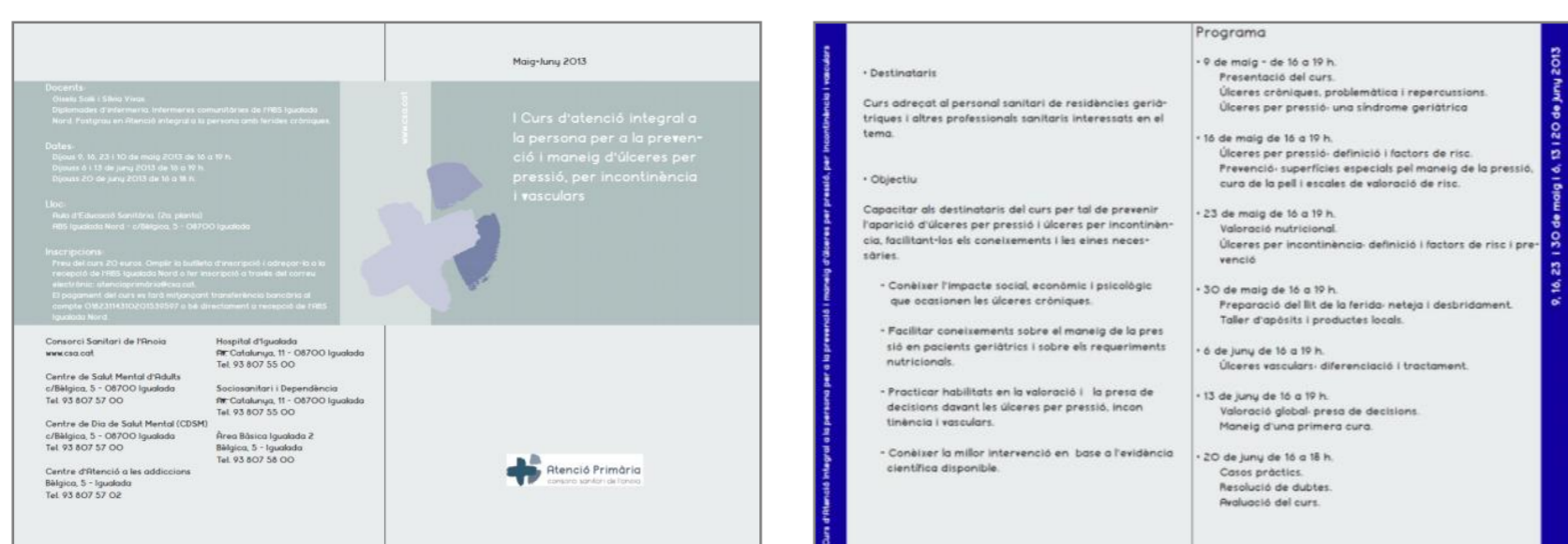
Imatges 1 i 2. Tríptic informatiu del curs.