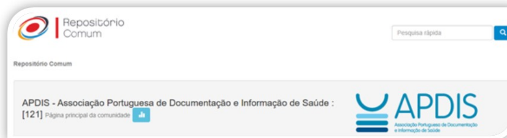
Figura 1 – Repositório APDIS

O Repositório APDIS (criado em março de 2019) possui 121 documentos e 210 downloads.