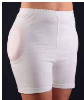
Figura 1: Protector de cadera Fall-safe Assist Figura 2: Protector de cadera Fall-Safe incrustado

Según el fabricante, el Fall-Safe Assist detecta automáticamente una caída, anomalías en el patrón de la marcha o si el paciente está inmóvil después de una caída durante un tiempo predefinido, generalmente 30 segundos. El sistema registra los datos y envía un mensaje de alarma a través de un móvil vinculado a un bluetooth y envía también un mensaje (SMS) para alertar al servicio de urgencias.