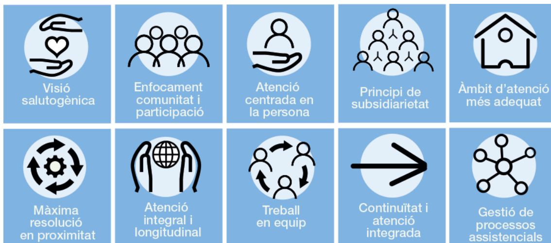
Gràfic 1. Decàleg de l'atenció primària i comunitària

Actualment, algunes de les activitats i serveis que assenyalava la cartera de serveis de l'APiC no estan desplegadas a tot el territori. Cal, així doncs, que tant l'Administració com els proveïdors i els professionals de l'APiC treballin per aconseguir que aquesta oferta de serveis a la ciutadania es pugui garantir de forma territorialment homogènia i socialment equitativa. Això requereix un repte de